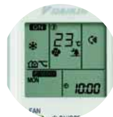
Trådløs fjernbetjening (standard) ARC452A1